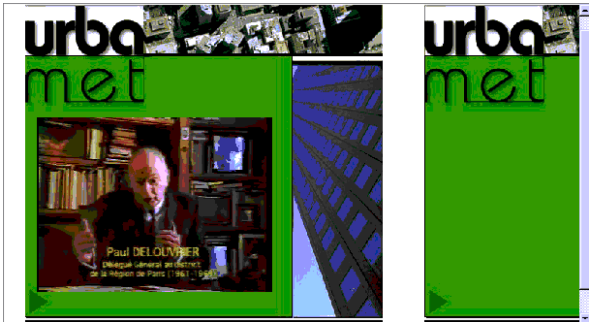
Vidéo « Organiser la ville : l'expérience française de planification urbaine » : interview de Paul Delouvrier

Windows 98. Les films sous Windows media player seront visibles dans leur intégralité (environ 15 mn). 2 versions sont proposées, une en 56 Kbits – version dégradée plus légère à charger lorsque la connexion n'est pas bonne – et version 128 Kbits, de meilleure qualité mais plus lourde à charger.